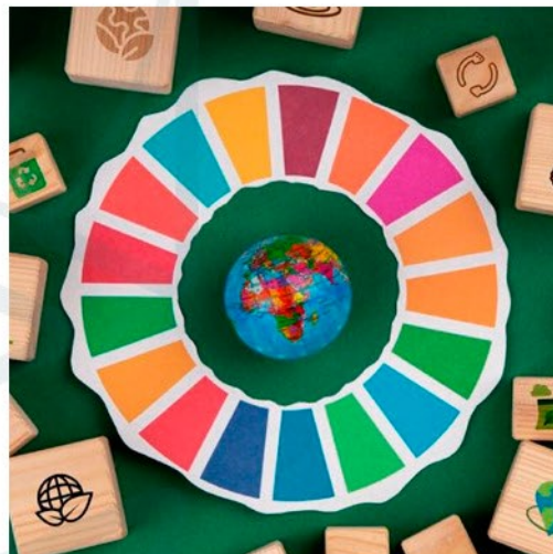
Imagen de World Compliance Association